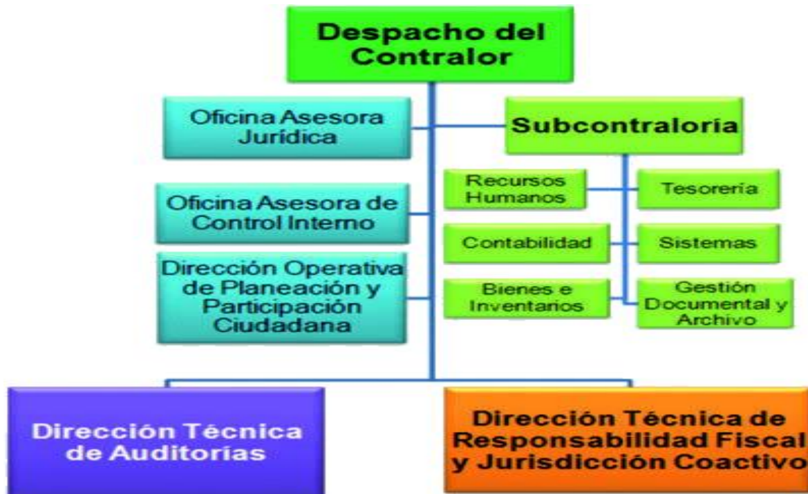
Figura 1. Organigrama de la Contraloría Municipal de Pereira,